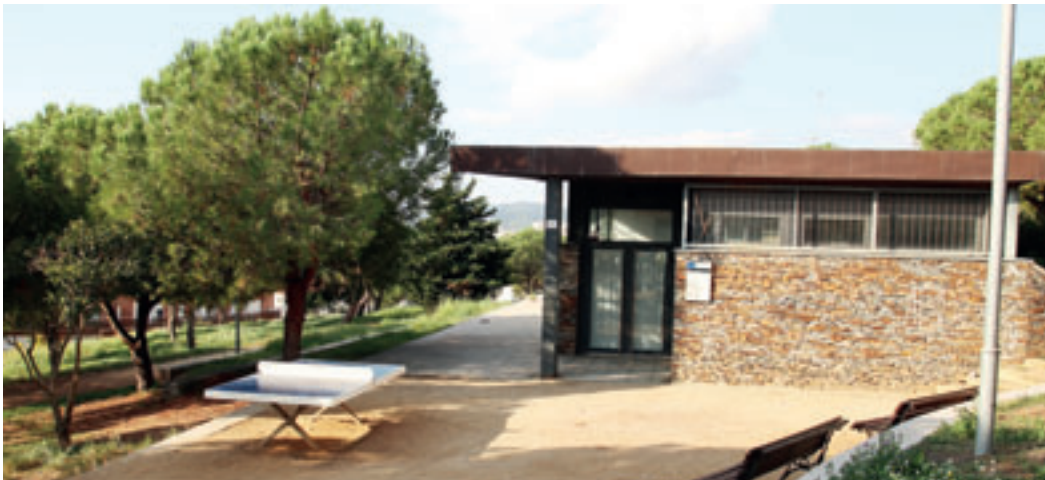
El Parc del Nord acull el Centre Social Carrer d'Almeria.